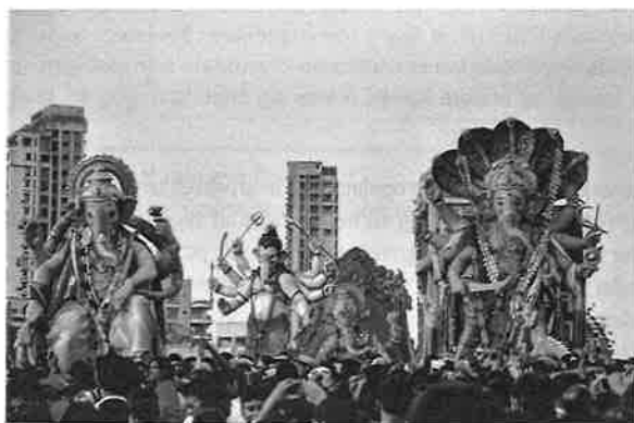
Hinduer bærer guden Ganesha ud i havet.

Når vi studerer religion, bruger vi forskellige teorier, som på hver deres måde kan forklare sammenhænge og give en bedre forståelse for religioner og religiøsitet. Nogle af disse teorier bliver præsenteret her i Begrebsnøglen . Religionsfagets metode handler om, hvordan vi arbejder, og fra hvilke synsvinkler vi anskuer tingene. Her beskrives fem grundlæggende metodiske tilgange, som har fokus på hver deres side af menneskers religiøse liv: